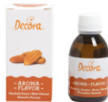
Aroma Mandorla Amara Bitter Almond Flavor