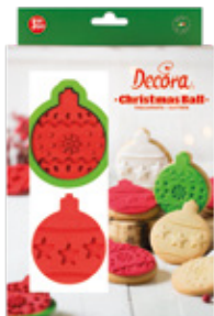
Xmas Ball Tagliapasta Xmas Ball Cutters

Sift the flour and arrange it on a work surface. Add the diced cold butter, the sugar, the grated rind of a lemon and the salt in the center. Start kneading with your fingertips until you will get a grainy mixture. Combine the eggs in the center and work everything very quickly until you get a compact dough. Make a loaf, wrap it in some cling film and let it rest in the refrigerator for at least an hour. After the resting time, roll out the pastry dough until you get a thickness of about 1 cm. Use the pastry cutter to cut out the shape of the ball and the stamps to get the decoration inside. We recommend flour the stamps to obtain a perfect shape and prevent it from sticking to the dough. Bake in a static oven at 160° C for about 12 - 15 minutes, checking the cooking frequently. Let them cool before decorating. Use the colored sugar paste to decorate the cookies using the same cutters.