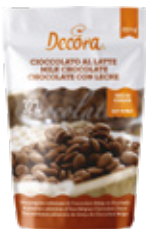
Ciocolato in Dischetti Chocolate Discs