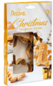
Tagliapasta in Metallo Metal cutters