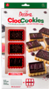
CiocCookies Kit Kit CiocCookies