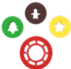
Tagliapasta Mix & Match Natale Christmas Mix & Match Cutters