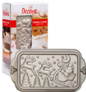
Stampo Santa Claus Santa Claus Pan

Separate the yolks from the whites. Whip the egg whites in a bowl with an electric whisk for about 5 minutes and keep them aside. In another bowl, sift the flour 00, the almond flour, the baking powder, the sugar and the baking soda. Pour the lightly beaten egg yolks, the oil, the milk and a few drops of Almond Flavor into the flour mixture. Mix the ingredients well, using a hand whisk. Add the beaten egg whites to the mixture, stirring gently with a spatula. Pour the mixture into the plum cake mold, previously oiled with the Non-stick Spray. Bake at 160° C for about 50 minutes. Let the cake cool on the appropriate cooling rack and decorate at taste with Royal Ice and Glitter Sugar.