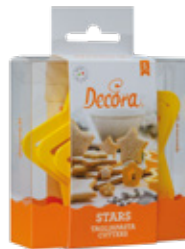
Tagliapasta Stars Stars Cutters