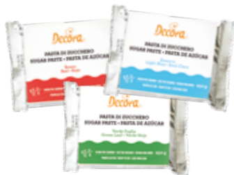
Pasta di Zucchero Sugar Paste