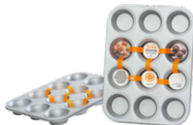
Teglia Muffin Muffin Pan