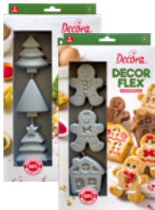
Stampi in Silicone di Natale Christmas Silicone Molds