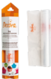
Sac à Poche Monouso Disposable Piping Bags