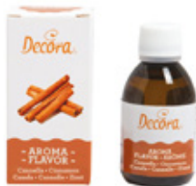
Aroma Cannella Cinnamon Flavor