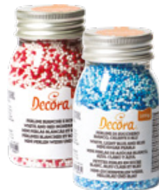
Decorazioni in Zucchero Sugar Decorations