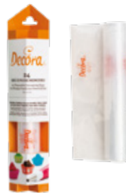
Sac à Poche Monouso Disposable Piping Bags