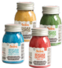
Zuccheri Glitterati Extra Fini Extra Fine Glittered Sugars