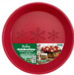
Stampo Celebration Celebration Mold

In a bowl, sift the flour with the baking powder, add the sugar and a pinch of salt. Divide the egg yolks from the whites in two bowls: mix the egg yolks with the oil and the milk, add the flour and blend all the ingredients well. Whip the egg whites and the cream of tartar with an electric whisk and add them to the mixture stirring gently with a spatula. Pour the dough into the greased and floured pan and bake in a static oven at 180° C for about 35 minutes. Let the cake cool before taking it out of the pan. In the meantime melt the chocolate glaze following the instructions on the package and decorate the cake by letting it run on the sides. Add the fresh raspberries and finally sprinkle them with icing sugar.