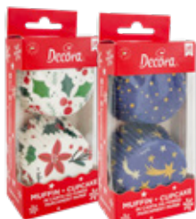
Pirottini Baking Cups