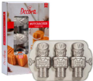
Stampo Schiaccianoci Nutcrackers Pan

In a bowl, whisk with an electric mixer the butter and the sugar. Add the eggs and beat until the mixture is light and fluffy. Pour the yogurt and mix gently. Use a hand whisk to mix. Combine the sifted flour with the baking powder. Finally add a few drops of aroma and a pinch of salt and blend it well. Pour the mixture into the cavities for 2/3 full, previously oiled with the Non-stick Spray. Bake in the oven for about 25 minutes at 180° C. Let them cool before taking them out of the pan. Decorate your Nutcrackers with Royal Ice and Glitter Sugar.