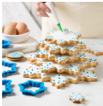
Gel Colorante Coloring Gel