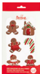
Decorazioni in Zucchero Natale Christmas Sugar Decorations