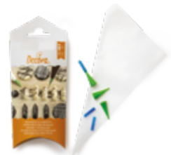
Set Sacchetti e Cornetti per Scrivere Piping Bag and Nozzles Writing Set