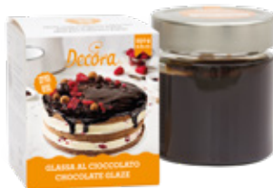
Glassa al Cioccolato Chocolate Glaze