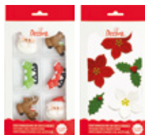
Decorazioni in Zucchero Sugar Decorations