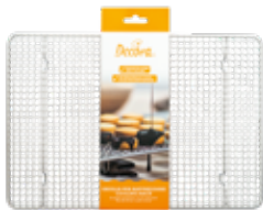
Griglia Raffredda-Torta Cooling Rack