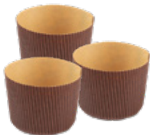
Forma Canasta/Panettone Canasta/Panettone Pans

Pour the warm milk into a bowl and dissolve the brewer's yeast stirring with a spoon. Add the honey and continue mixing. Pour the milk into the sifted flour and mix with a hand whisk until getting a smooth consistency. Cover the pre-dough with the cling film and place it in the oven off, with the light on, to rise for about 50 minutes. After the rising time, add to the pre-dough the flour, a little at a time, starting to knead with your hands. Combine the sugar, the egg, the honey and a pinch of salt. Finally, add the butter, a little at a time. Continue to knead until you get a soft dough. Place the dough in a bowl covered with cling film and let it rise in the oven with the light on for about 90 minutes. After the rising time, work the dough again with your hands and add the chocolate chips and the raisins previously softened in water and well squeezed. Divide the dough into 6 balls of the same weight, place them in each mold and let them rise another hour in the oven with the light on. Brush them with fresh liquid cream and bake in the oven at 180 ° C for about 20 - 25 minutes. Let it cool and in the meantime mold and roll out the white and red sugar paste for finish the cakes. Finally, add the ready-to-use sugar decorations gluing them to the sugar paste with a brush moistened with water.